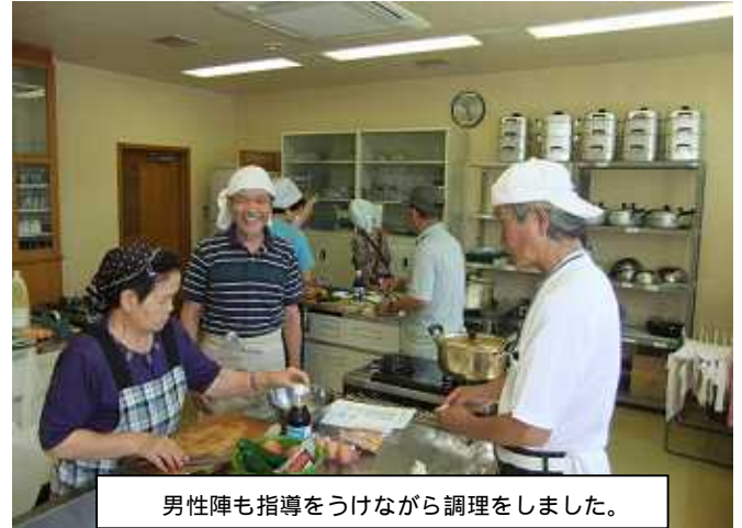
男性陣も指導をうけながら調理をしました。