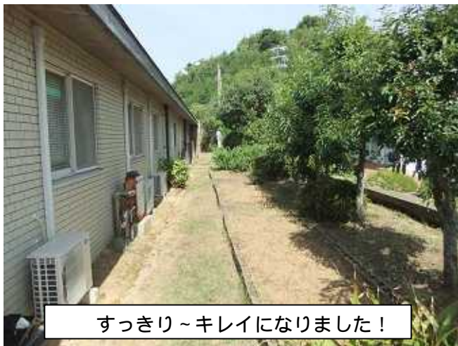
すっきり～キレイになりました!