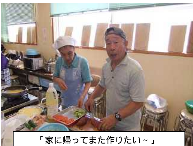
「家に帰ってまた作りたい〜」