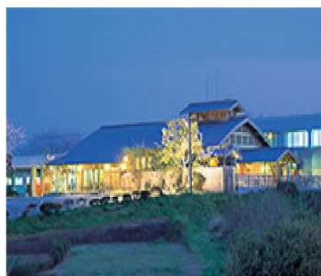
熊本菊鹿温泉旅館：花富亭