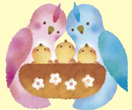
Shibahara · Chi